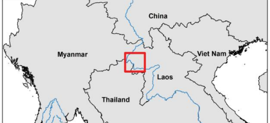
Map of Project Location