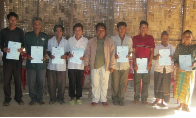
ຜູ້ທີ່ໄດ້ຮັບໃບຢັ້ງຢືນສວນບູກໄມ້ສັກ ຄົນທ່າອິດ ຂອງໂຄງການພ່ອນໄພ ຢູ່ບ້ານຫ້ວຍທອງ