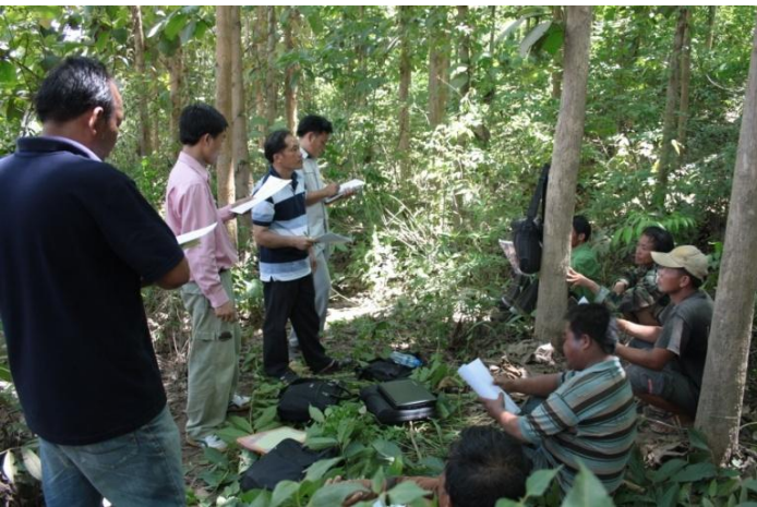
ພະນັກງານ ຂອງພະແນກກະສິກຳ ແລະ ປ່າໄມ້ແຂວງ ແລະ ພະນັກງານຂອງຫ້ອງການກະສິກຳ ແລະ ປ່າໄມ້ເມືອງ ໃນການຝຶກອົບຮົມກ່ຽວກັບການຕີລາຄາໄມ້ຢືນຕົ້ນ