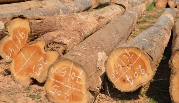
ສຳລັບການຂາຍ: ທ່ອນໄມ້ສັກທີ່ວົງທະບຽນ ຢູ່ແຄມທາງ