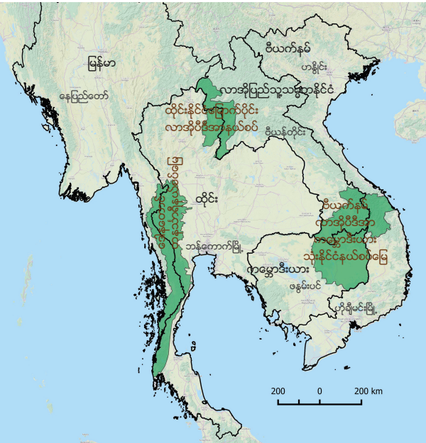
ပုံ ၂ - စီမံကိန်းလုပ်ငန်းမှ အဓိကထားဆောင်ရွက်နေသော သုံးနိုင်ငံနယ်စပ်နယ်မြေများ