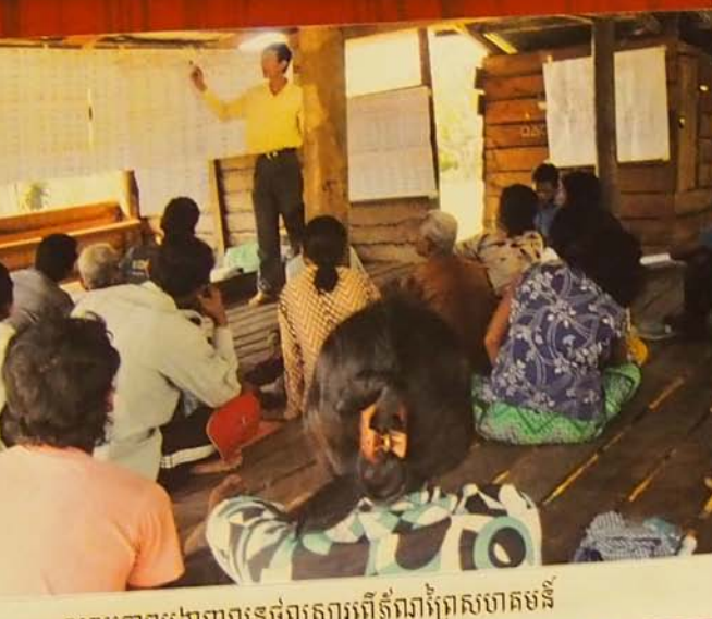
សកម្មភាពបង្ហាញលទ្ធផលសារព័ត៌មានក្រៅសហគមន៍