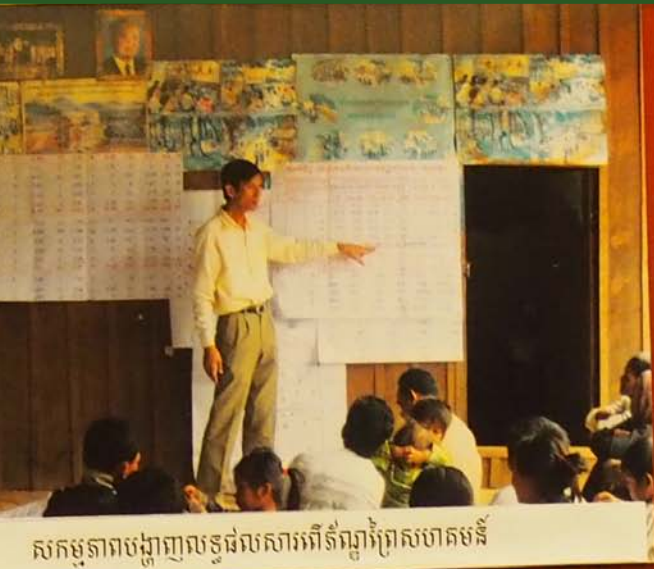
សកម្មភាពបង្ហាញលទ្ធផលសារព័ត៌មានក្រៅសហគមន៍