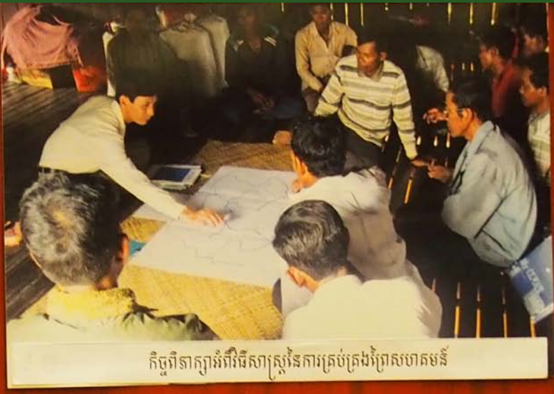
កិច្ចពិភាក្សាអំពីវិធីសាស្ត្រនៃការគ្រប់គ្រងព្រៃសហគមន៍