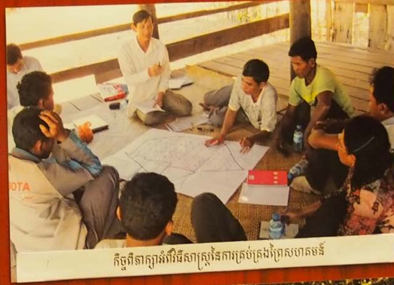
កិច្ចពិភាក្សាអំពីវិធីសាស្ត្រនៃការគ្រប់គ្រងព្រៃសហគមន៍