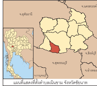
แผนที่แสดงที่ตั้งตำบลเนินขาม จังหวัดชัยนาท

แผนที่การวิเคราะห์ประโยชน์ที่ดิน ป่าชุมชนเขาราวเทียนทอง ต.เนินขาม อ.เนินขาม จ.ชัยนาท