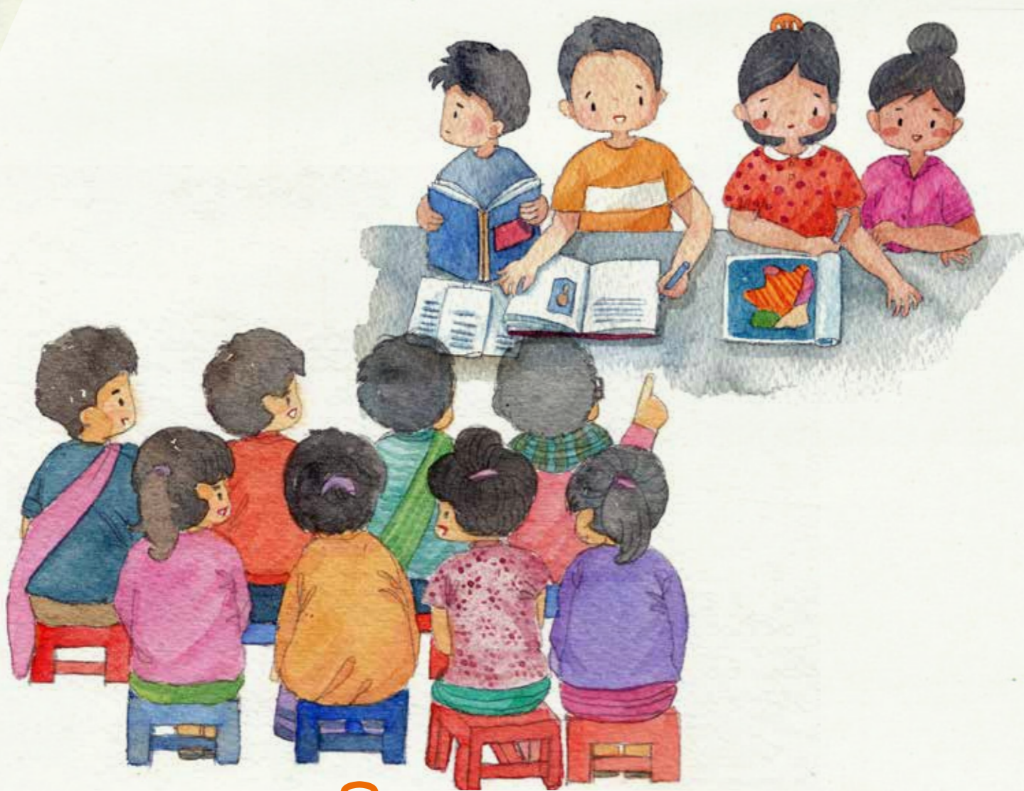
ການຕິດຕາມ-ກວດກາ ແລະ ລາຍງານ