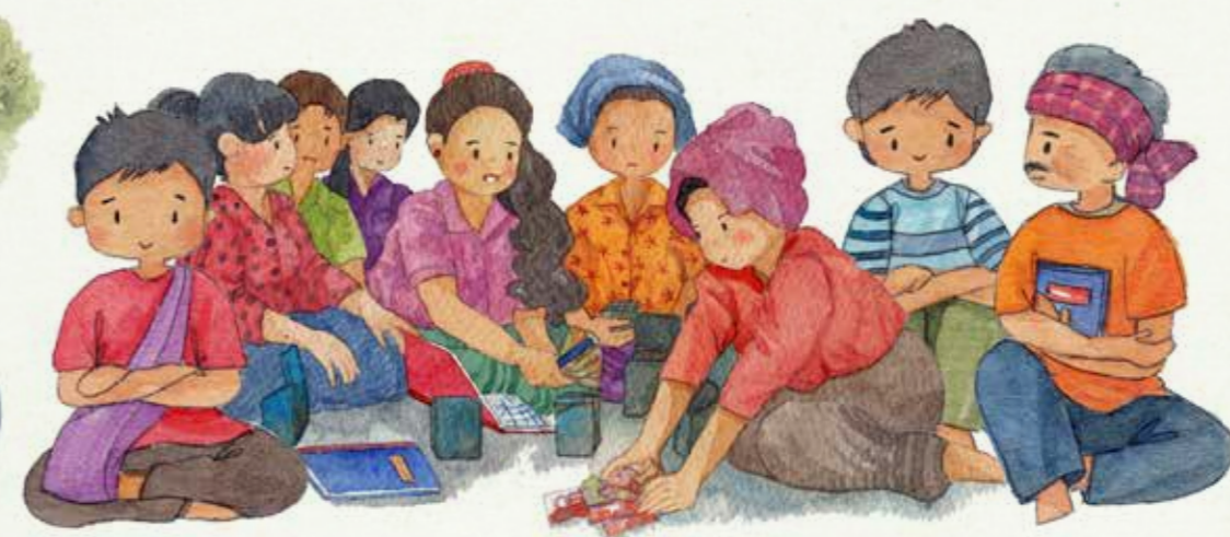
ການຈັດຕັ້ງປະຕິບັດກິດຈະກຳ ການຄຸ້ມຄອງປ່າໄມ້