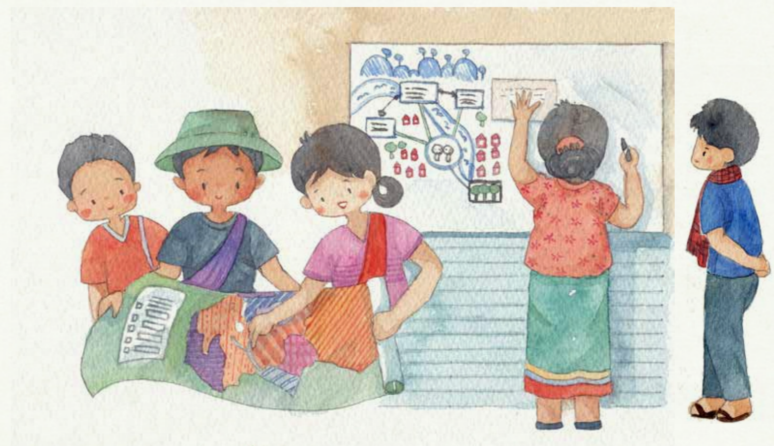
ການວາງແຜນ