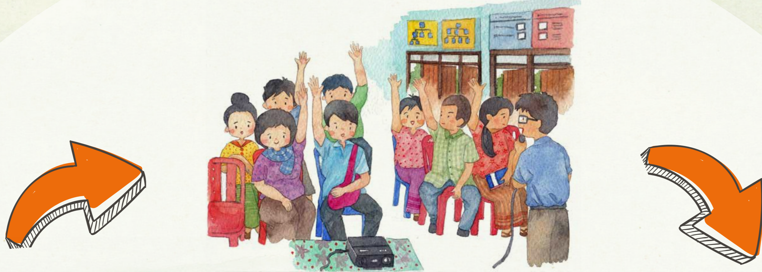
ການກຳນົດເປົ້າຫມາຍ