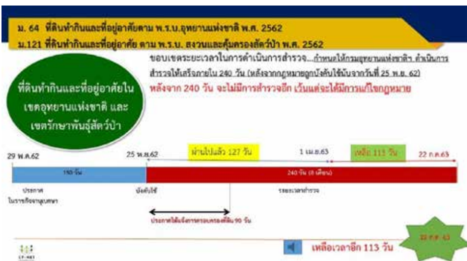
รูปที่ 1 ระยะเวลาในการสำรวจที่ดินทำกินและที่อยู่อาศัยในพื้นที่อุทยานแห่งชาติและเขตรักษาพันธุ์สัตว์ป่า

นอกจากเขตที่ทำกิน ที่อยู่อาศัยแล้วในพื้นที่อุทยานแห่งชาติยังต้องสำรวจแนวเขตพื้นที่ป่าและสำรวจทรัพยากรธรรมชาติที่สามารถเกิดใหม่ทดแทนได้ เช่น พืชอาหาร พืชสมุนไพรของป่าต่าง ๆ ซึ่งระบุในมาตรา 65 ก็ต้องสำรวจและจัดทำข้อมูลให้แล้วเสร็จภายในช่วงเวลาเดียวกัน ในส่วนพื้นที่เขตรักษาพันธุ์สัตว์ป่านั้นกำหนดให้จัดทำเขตเก็บหาทรัพยากรธรรมชาติที่สามารถเกิดใหม่ทดแทนได้ไว้เช่นกัน แต่ไม่ได้รับเงินชดเชยช่วงเวลาเหมือน พ.ร.บ.อุทยานฯ ให้ดำเนินการโดยพิจารณาตามความพร้อมของเขตรักษาพันธุ์สัตว์ป่าร่วมกับชุมชน