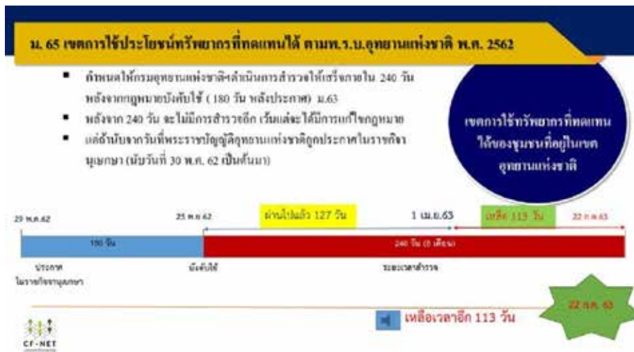
รูปที่ 2 ระยะเวลาในการสำรวจข้อมูลขอบเขตและชนิดของทรัพยากรที่ทดแทนได้ตามมาตรา 65 พ.ร.บ. อุทยานแห่งชาติ