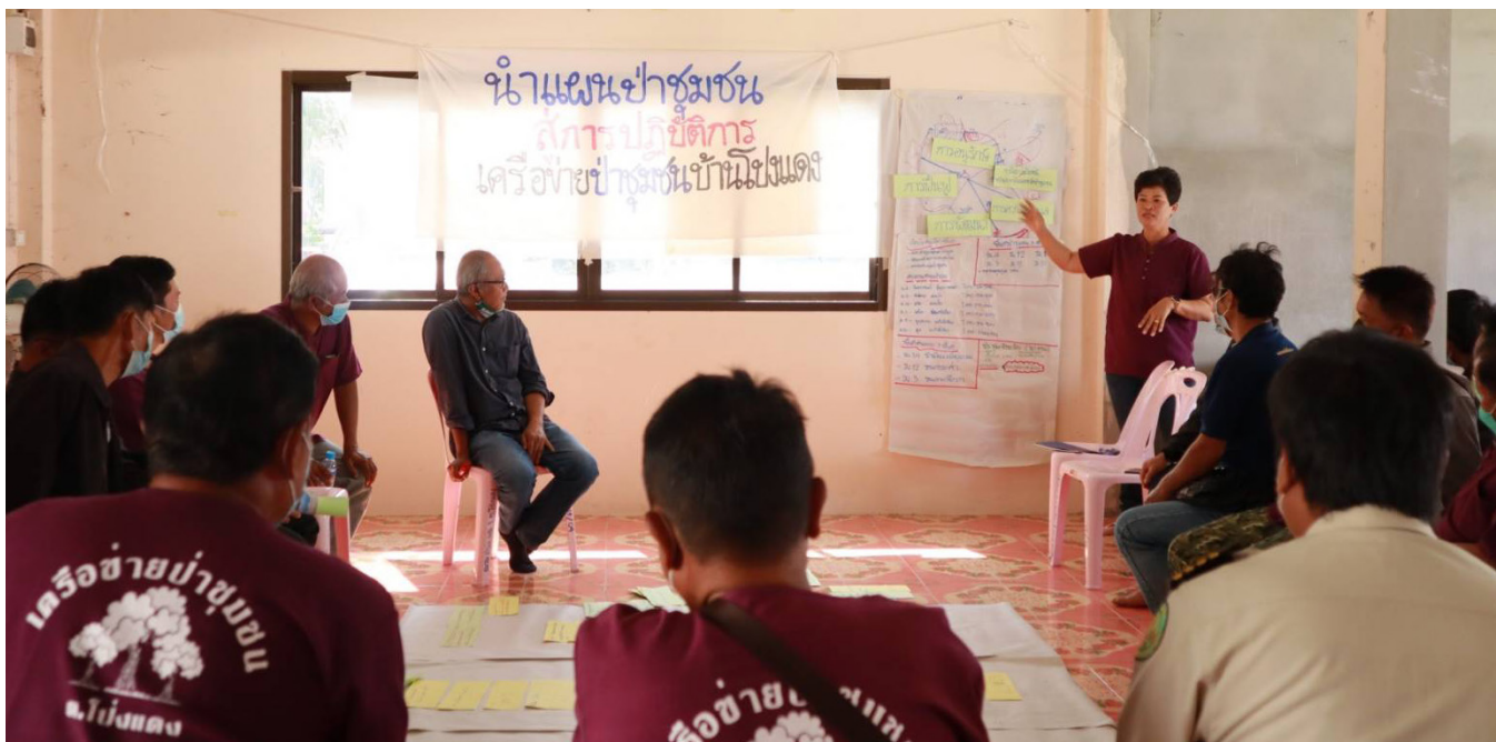
บรรยากาศเวทีประชุมแลกเปลี่ยนระดับจังหวัด ที่จังหวัดตาก

องค์กรที่เลี้ยงช่วยเสริมศักยภาพให้บุคคลในเครือข่าย เช่น คณะกรรมการระดับจังหวัด คณะกรรมการชุมชน 4. เมื่อจัดเวทีระดับจังหวัด ควรกำหนดเนื้อหาและข้อมูลที่จะพูดคุยร่วมกัน เช่น เน้นติดตามการอนุมัติแผนการจัดการคุณภาพแผนการจัดการ ประเด็นที่จะนำเสนอในการหารือกับคณะกรรมการป่าชุมชนจังหวัด ประเด็นเพิ่มเติมอย่างคาร์บอนเครดิต ตลอดจนข้อมูลในการสะท้อนบทเรียน ข้อมูลพื้นฐานระดับจังหวัด และควรพัฒนาสื่อเพื่อส่งข้อมูลข่าวสารให้เครือข่าย เช่น ปฏิทินข่าว