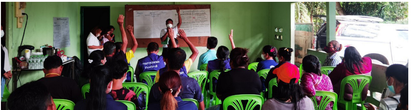
ประชุมเครือข่ายป่าไม้ภาคพลเมือง จังหวัดสุราษฎร์ธานี

สำหรับงานเครือข่ายป่าไม้ภาคพลเมืองตั้งแต่เดือนสิงหาคม 2565 จนถึงเดือนมกราคม 2567 พวกเราได้รับการสนับสนุนจากกองทุนรวมธรรมาภิบาลไทยหรือ Corporate Governance Fund (CGFund) เพื่อยกระดับกิจกรรมของเครือข่ายฯ ควบคู่ไปกับการบริหารเครือข่ายฯ อย่างมีธรรมาภิบาล