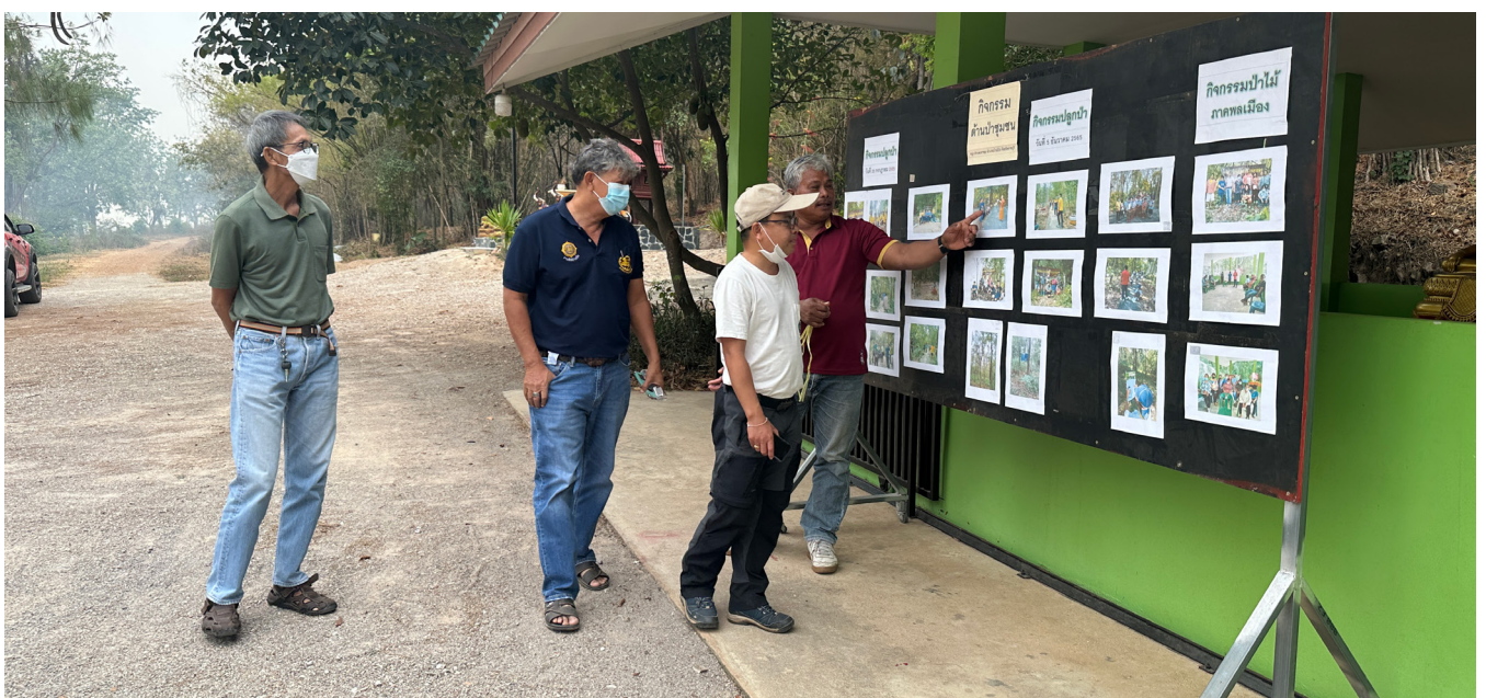
เวทีเตรียมความพร้อมโรงเรียนป่าชุมชนบ้านสระสีมูม จังหวัดราชบุรี