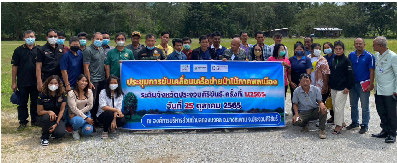
สมาชิกเครือข่ายฯ ประชุมขับเคลื่อนงานระดับจังหวัด ที่จังหวัดประจวบคีรีขันธ์