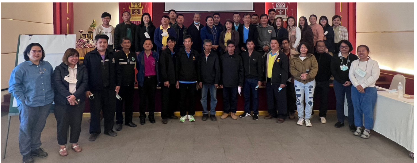
เวทีหารือเครือข่ายป่าไม้ภาคพลเมือง จังหวัดน่าน

ถึงแม้เราจะเริ่มที่การพัฒนาพื้นที่นำร่อง 10 จังหวัดจาก 38 จังหวัดก่อน แต่เราจะต้องเดินหน้าสนับสนุนกลไกการประสานงานในทุกจังหวัดและสานต่อการแลกเปลี่ยนเรียนรู้ระหว่างเครือข่ายป่าไม้ภาคพลเมือง เพื่อให้ทุกคนได้เคลื่อนขบวนไปในทิศทางเดียวกัน พร้อมเสริมสร้างความเข้มแข็งของพลเมืองสร้างป่า ซึ่งเป็นผู้ดูแลรักษาและควรได้รับประโยชน์จากป่าอย่างแท้จริง